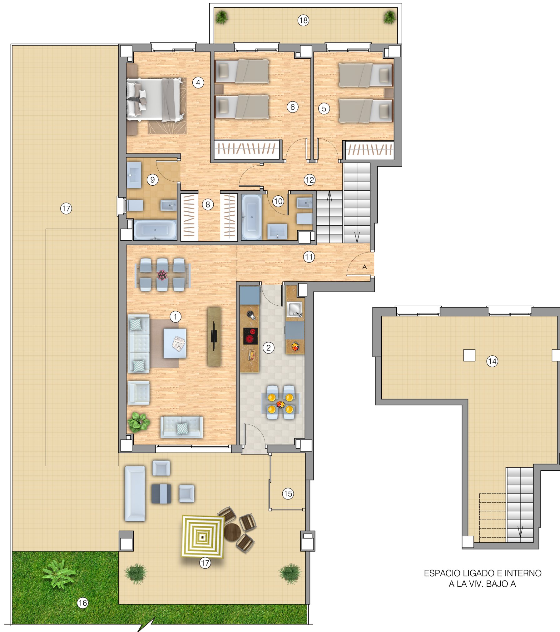
ESPACIO LIGADO E INTERNO A LA VIV. BAJO A